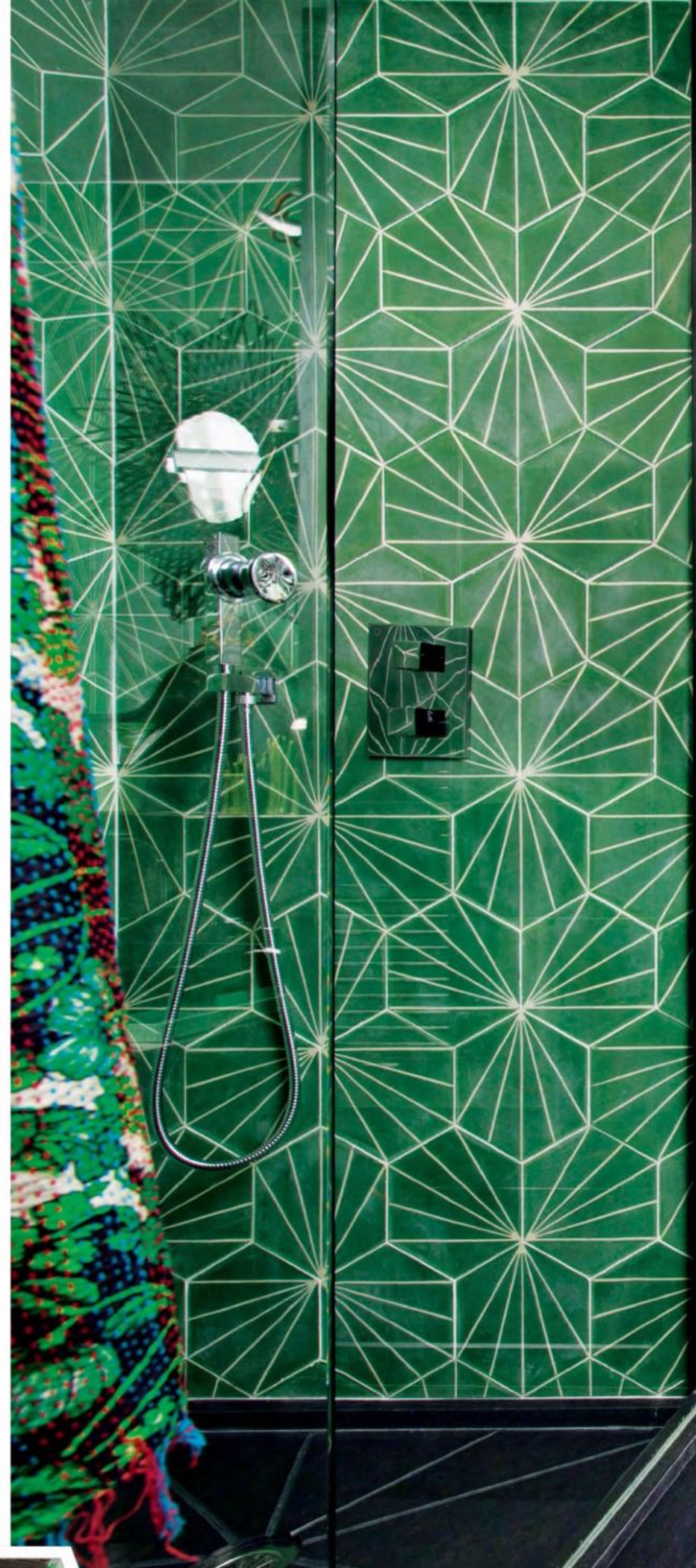
绿色卫生间的台盆安在一个老的金属架子上。黑色台盆与“Dandelion”绿色地砖（Marrakech Design）相映成趣。吊灯以及掩藏在老式镜子后面的壁橱，都是由Hubert Zandberg设计的。