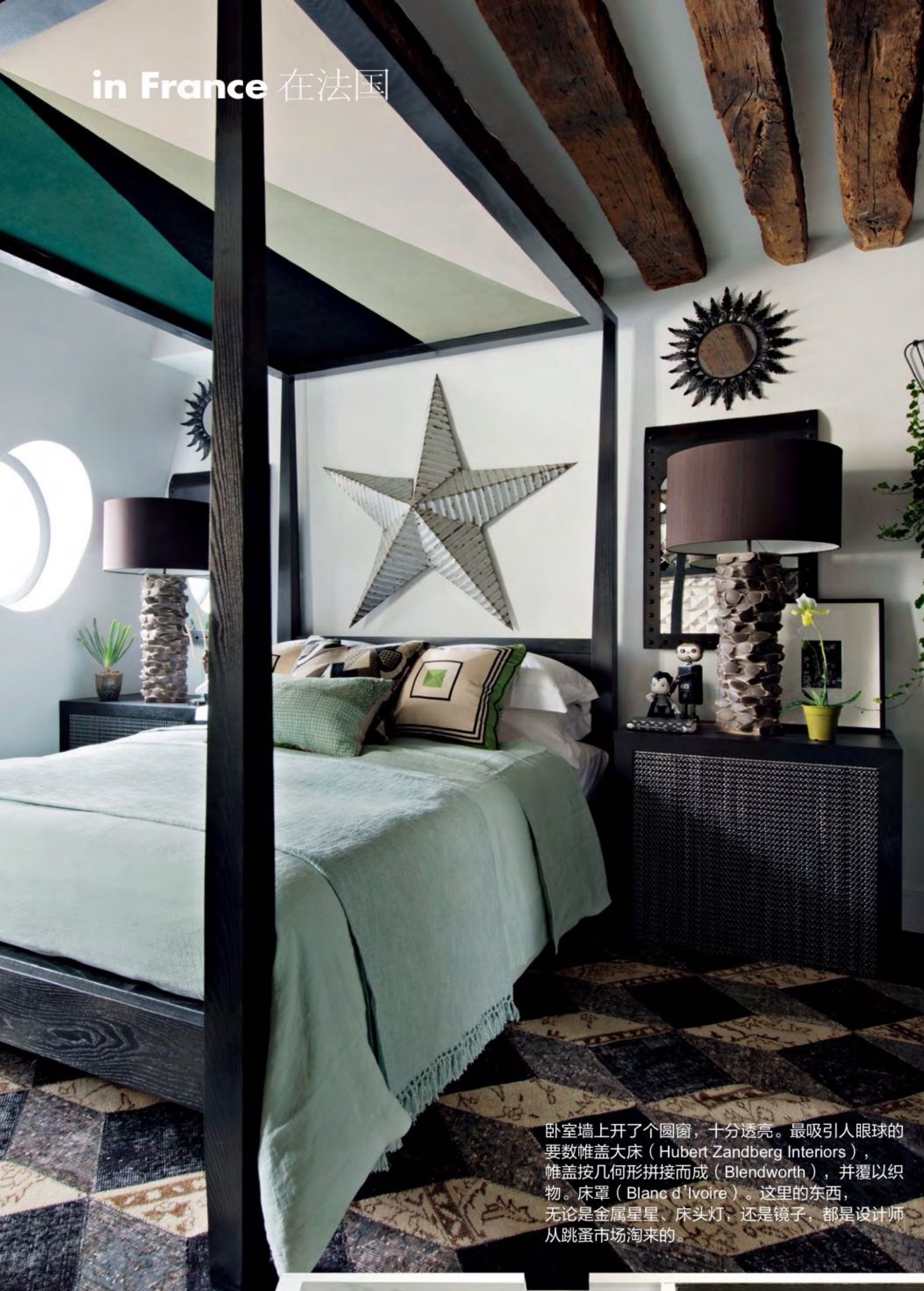
卧室墙上开了个圆窗，十分透亮。最吸引眼球的是数帷盖大床（Hubert Zandberg Interiors），帷盖按几何形拼接而成（Blendworth），并覆以织物。床罩（Blanc d'Ivoire）。这里的东，无论是金属星星、床头灯，还是镜子，都是设计师从跳蚤市场淘来的。