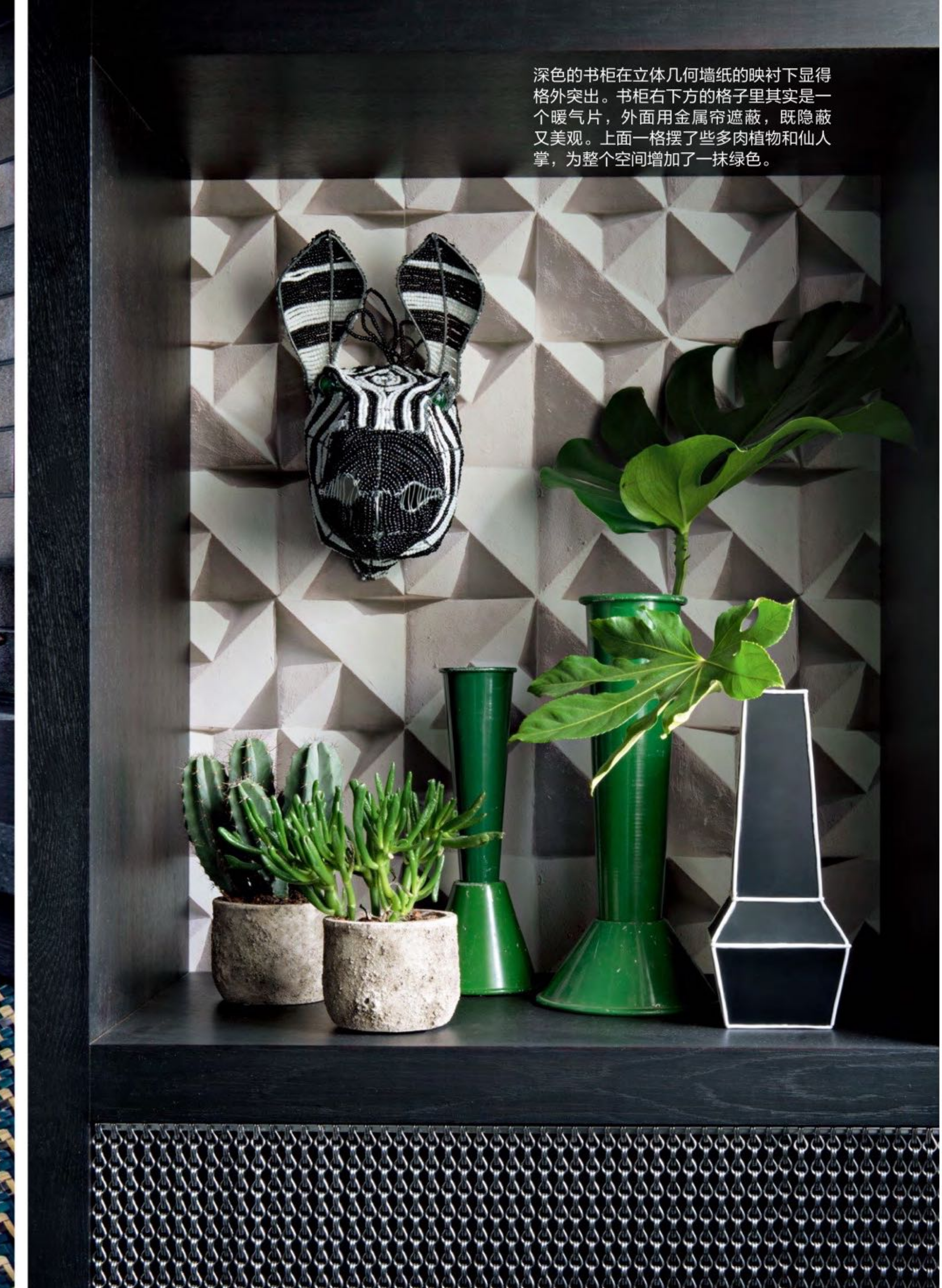
深色的书柜在立体几何墙纸的映衬下显得格外突出。书柜右下方的格子里其实是一个暖气片，外面用金属帘遮蔽，既隐蔽又美观。上面一格摆了些多肉植物和仙人掌，为整个空间增加了一抹绿色。

旧时的玛黑区早已远去，无论小街巷还是矮房子，都已进入历史。这套玛黑区的30平米小公寓迎来了新主人，并交由室内设计师Hubert Zandberg重新改造，希望这里能成为一个适合短期居住的时尚小窝。